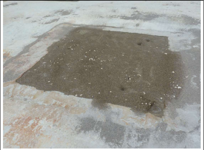
...n'est toujours pas cimentée.