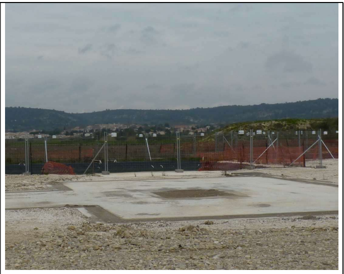
...a maintenant disparu.