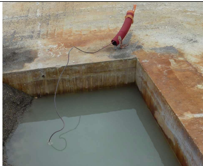
Le câble de la sonde, encore visible en août dernier...