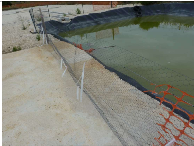
Situation au 30 août 2012