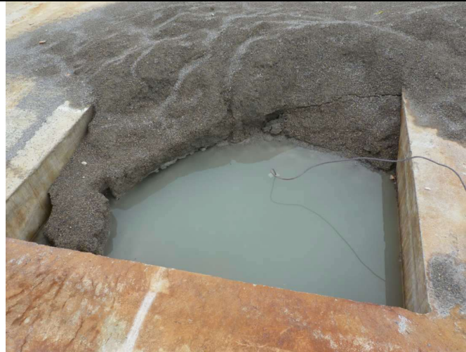
La tête de puits imparfaitement bouchée avec du sable...