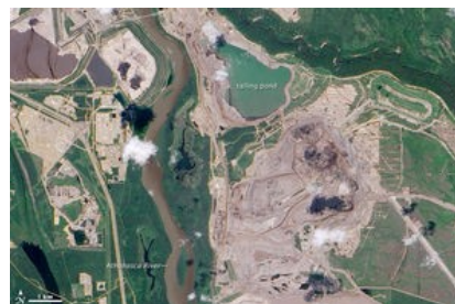
Sables bitumineux Athabasca Nasa

Après un bras de fer de plusieurs années avec l'industrie pétrolière, le Parlement européen a finalement renoncé à pénaliser l'import de pétrole de sables bitumineux au titre des 23% d'émissions de CO 2 supplémentaires que provoque leur procédé d'extraction, par rapport aux pétroles conventionnels.